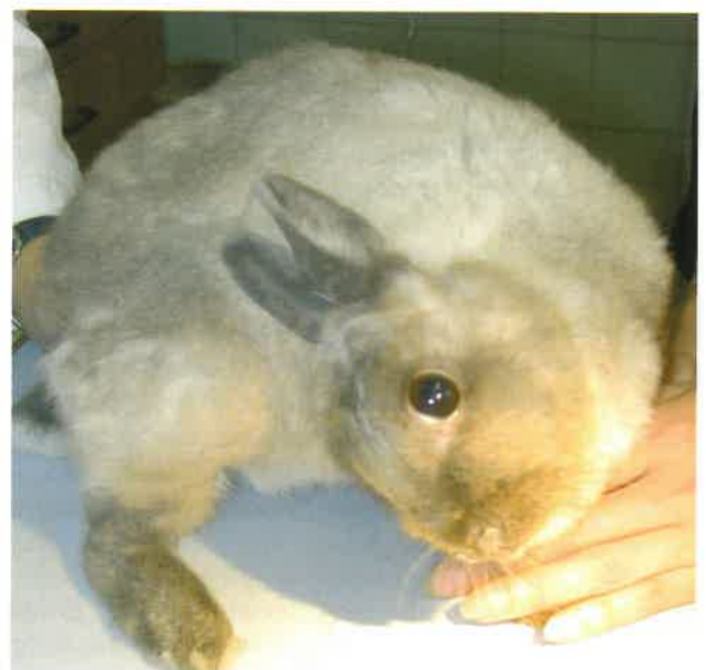
Figure 2 — Lapin atteint de syndrome vestibulaire

L'animal atteint présente une déviation du port de tête et une ataxie asymétrique (cf. figure 2). Il marche en cercle, perd facilement l'équilibre et peut effectuer des roulés-boulés. Le tonus musculaire est réduit du côté de la lésion et augmenté du côté opposé. Un nystagmus et un strabisme sont fréquemment associés.