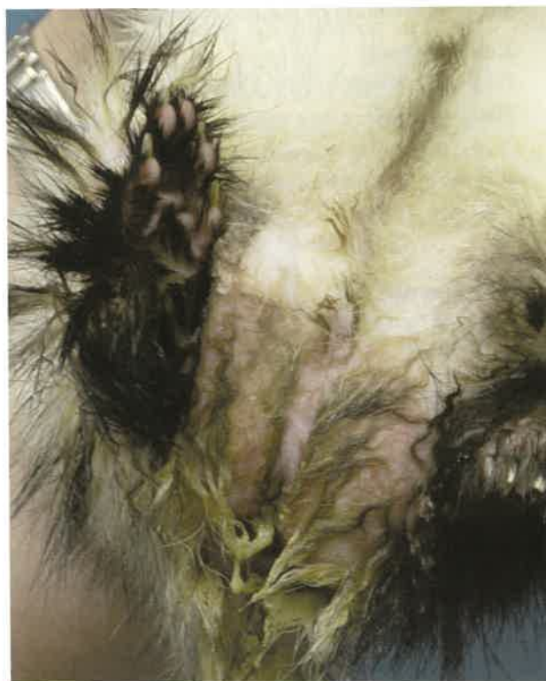
Figure 2 — Souillure du train arrière lors de diarrhée (C. Bulliot)

Concernant les aliments, les taux conseillés sont les suivants (% élevés conseillés pour les juniors et % bas pour les séniors) : taux de protéine : 30-40 % (protéines de volailles essentiellement), taux de