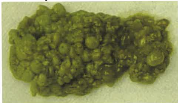
Figure 1 — Selles granuleuses et verdâtres lors de malassimilation digestive

Il est important pour évaluer le risque épidémiologique (corps étrangers plus fréquents chez les jeunes, animal casanier, vivant en liberté dans la maison ou sortant, participant à des expositions de furets, vivant avec des congénères ou des chiens et chats, échangé