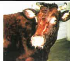
(Photothèque - Maladies contagieuses - ENVT)