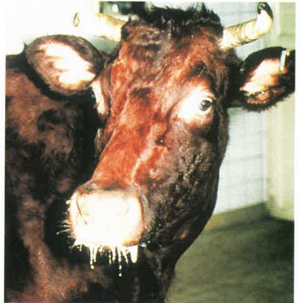
Figure 1 - Salivation abondante chez un bovin aphteux.

Professeur de Pathologie infectieuse Département de santé publique vétérinaire Ecole Nationale Vétérinaire 23, chemin des Capelles, 31076 Toulouse Cedex 3